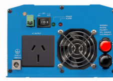
Phoenix Inverter 12/800 with AN/NZS 3112 socket