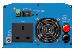
Phoenix Inverter 12/800 with BS 1363 socket