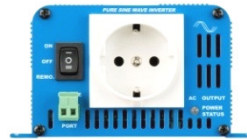
Phoenix Inverter 12/180 with Schuko socket