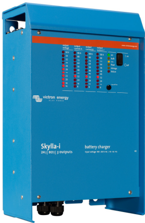
Skylla-i 24/100 (3)