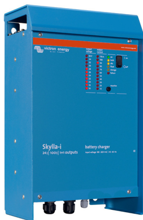
Skylla-i 24/100 (1+1)

Weitere Informationen über Batterien und das Laden von Batterien finden Sie in unserem Buch 'Energy Unlimited' (Uneingeschränkte Energie) (über Victron Energy kostenfrei erhältlich oder zum Herunterladen unter www.victronenergy.com ).