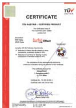
TÜV Turbo Tests