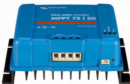
Solar-Laderegler MPPT 75/50